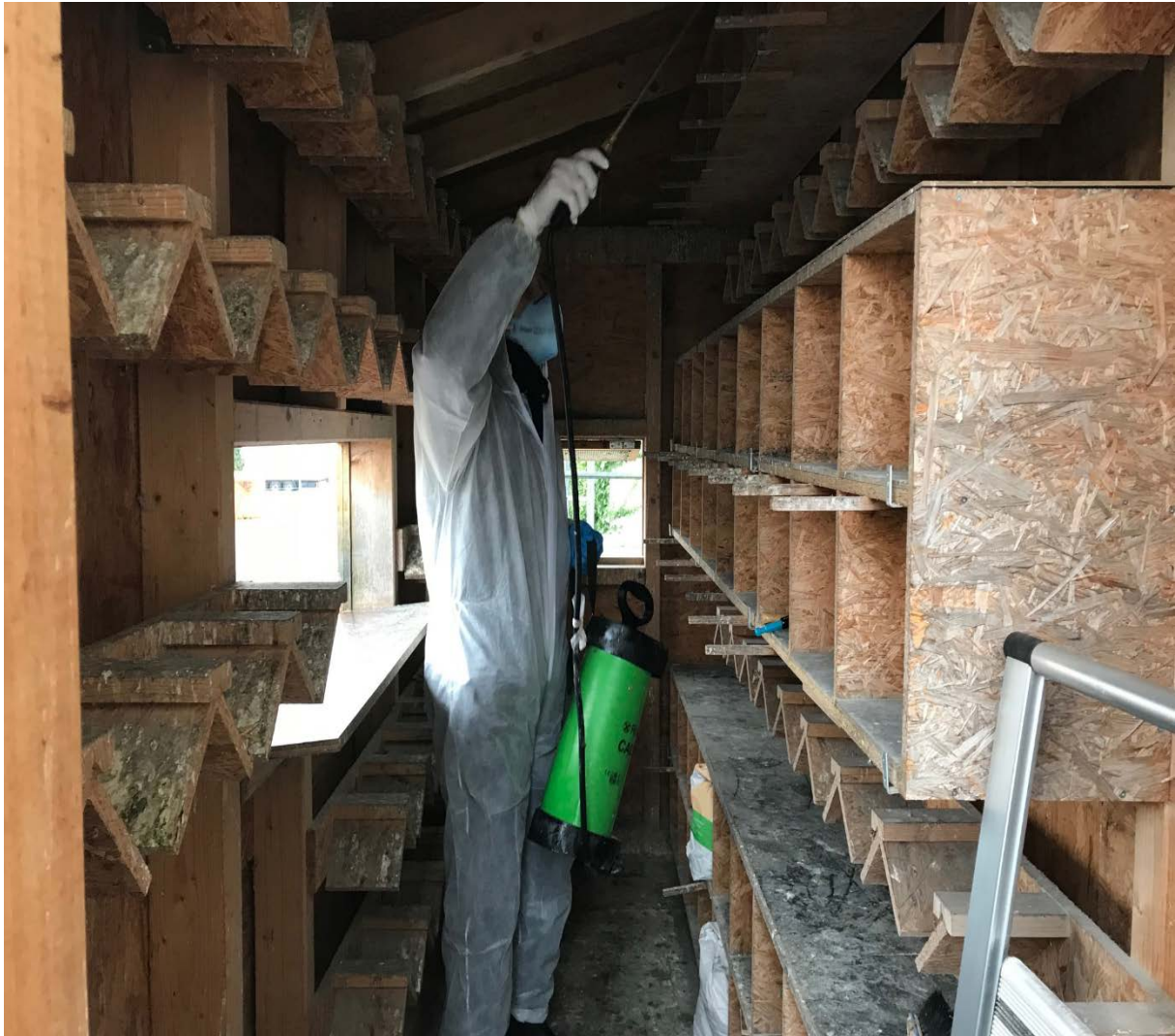
Chemische Reinigung und Desinfektion (mit Schutzkleidung)

Auch in diesem Jahr steht zum „Jahresabschluss“ das „Großreinemachen“ auf der Tagesordnung. Das heisst neben den normalen Reinigungsarbeiten wird eine „Grundreinigung“ durchgeführt, die auch eine chemische Reinigung und Desinfektion beinhaltet. Auch diese etwas „heikle“ Arbeit (Schutzanzug/Mundschutz zwingend erforderlich) wird durch die ehrenamtlichen Tierschützer durchgeführt.