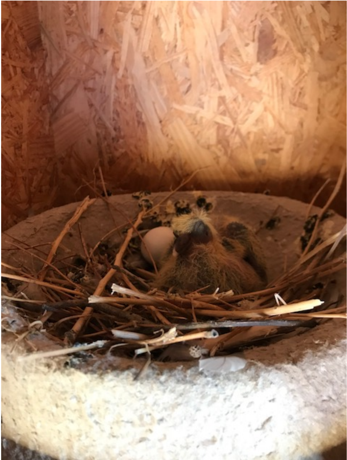
(Motivations-)Küken mit Gipsegeschwisterchen im „Nest“