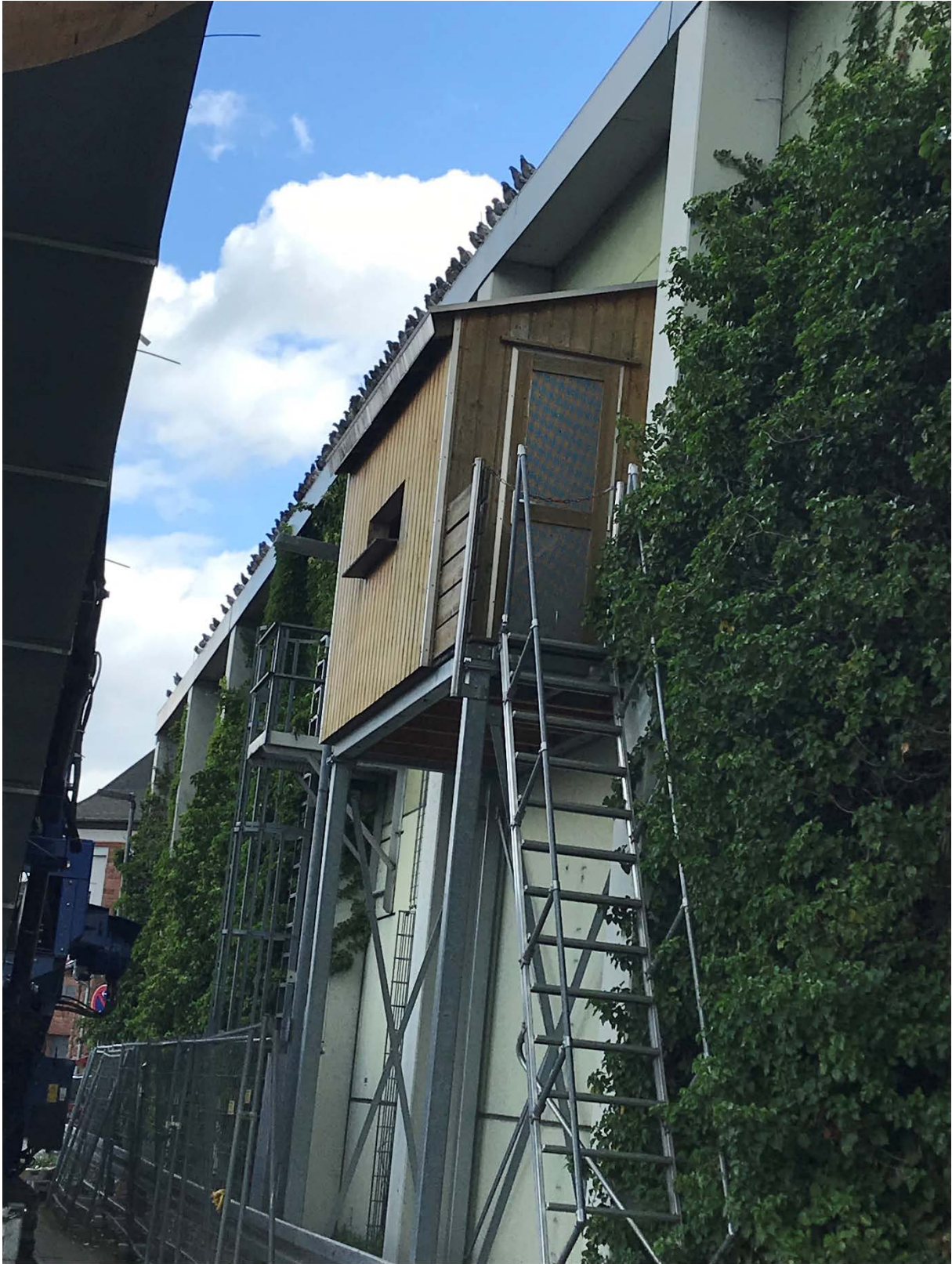
Ständig reges Treiben am Taubenhaus im Hafen Hanau ...